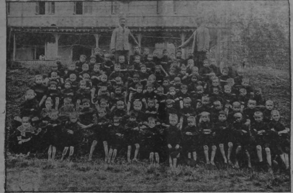
GRUPO DE NIÑOS HUÉRFANOS ASILADOS EN EL HOSPIICIO DE ESTA CAPITAL PARA QUIENES SE PRE PARA UNA SENCILLA FIESTA DE NAVIDAD